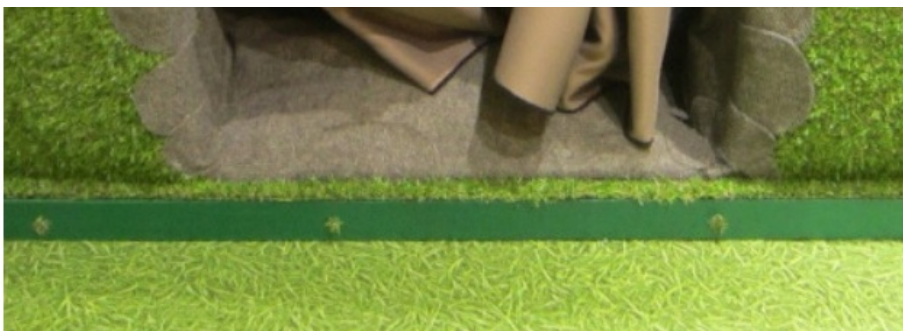
Проект «Медвежий угол», Национальный музей Республики Карелия. Победитель IX грантового конкурса музейных проектов в номинации «Музей для туриста», 2018.

В 2014 г. «Северсталь» привлекла «Форум Доноров» – ассоциацию грантодающих организаций, работающих в России, – для проведения внешней независимой оценки программы. В результате в 2015 г. была представлена обновленная структура «Музеев Русского Севера», включавшая конкурс на финансирование профессиональных поездок сотрудников музеев, межрегиональный форум, посвященный проблемам и перспективам интеграции музеев Русского Севера в туриндию, и грантовый конкурс музейно-туристских проектов.