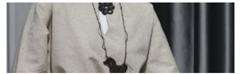
Проект «Lege artis (по всем правилам искусства)», Череповецкое музейное объединение. Победитель IX грантового конкурса музейных проектов в номинации «Музей для туриста», 2018

Идея благотворительной программы родилась как результат многолетнего сотрудничества «Северстали» с крупнейшими российскими музеями, с одной стороны, и музеями в регионах присутствия компании – с другой. Логичным продолжением стала реализация масштабной грантовой программы в «якорном» для корпорации регионе Русского Севера. Программа задумывалась как дополнительный инструмент поддержки музеев, который должен укрепить их статус центров духовной и интеллектуальной жизни регионов, мотивировать на поиск новых форм социально-культурной деятельности в эпоху глобальных перемен.